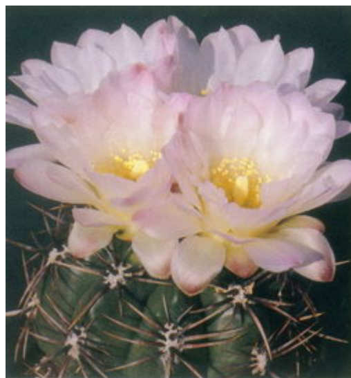
Figure 3 : Gymnocalycium achirasense , ou G. monvillei subsp. achirasense ?

L'aire de répartition des gymnos, comme on les appelle généralement, est considérable : de celui qu'on estime être le plus primitif, en Uruguay, s'étendant ensuite vers le nord au Brésil et au Paraguay, au sud et à l'ouest en Bolivie et en l'Argentine, où la plupart des espèces poussent, pouvant même aller dans le sud lointain comme en Patagonie. Personne n'en a jamais vu au Chili ou au Pérou, ni nulle part plus au nord.